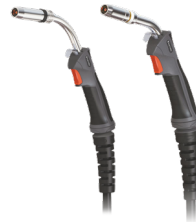
Tocha MIG 36-3 cabo 3m (1) Tocha MIG 501W-3 cabo 3m (2) Antorcha MIG 36-3 cable 3m (1) Antorcha MIG 501-3W cable 3m (2)