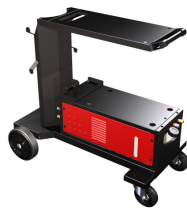
Carro S3 M MULTI BASIC (1) Carro S3 M MULTI BASIC (1) Carro S3 MW MULTI BASIC (2) Carro S3 MW MULTI BASIC (2)