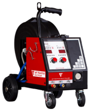
Alimentador AF 73.4R MULTI BASIC (1) Devanadora AF 73.4R MULTI BASIC (1) Alimentador AF 73.4R WMULTI BASIC (2) Devanadora AF 73.4R W MULTI BASIC (2)