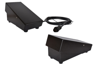
Pedal de controlo 3m (1) Pedal de controlo wireless (2) Pedal de control remoto 3m (1) Pedal de control remoto inalámbrico (2) REF. PF130043 (1) REF. PA130005 (2)

Novo design mais atraente, robusto e versátil, com maior facilidade de transporte.