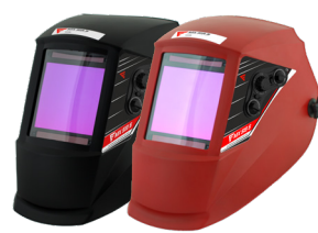
Máscara auto. MX 513 S vermelha (1) Máscara auto. MX 513 S preta (2) Pantalla auto. MX 513 S roja (1) Pantalla auto. MX 513 S negra (2) REF. CC108071 (1) REF. CC108072 (2)