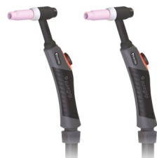
Tocha TIG 18W-4 cabo 4m (1) Tocha TIG 18W-8 cabo 8m (2) Antorcha TIG 18W-4 cable 4m (1) Antorcha TIG 18W-8 cable 8m (2) REF. CC107205 (1) REF. CC107206 (2)