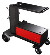
Carro A3 TP 503 AC/DC (1) Carro A3 W TP 503 AC/DC (2) Carro A3 TP 503 AC/DC (1) Carro A3 W TP 503 AC/DC (2) REF. PA109610 (1) REF. PA109218 (2)