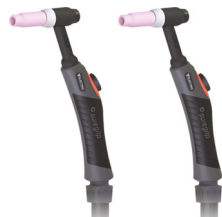
TIG torch 18W-4 cable 4m (1) TIG torch 18W-8 cable 8m (2) Torche TIG 18W-4 câble 4m (1) Torche TIG 18W-8 câble 8m (2) REF. CC107205 (1) REF. CC107206 (2)