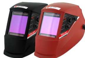
Welding helmet MX 513 S red (1) Welding helmet MX 513 S black (2) Masque automatique MX 513 S rouge (1) Masque automatique MX 513 S noir (2) REF. CC108071 (1) REF. CC108072 (2)