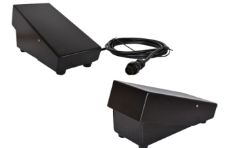
Foot pedal remote control 3m (1) Foot pedal remote control wireless (2) Pédale de commande à distance 3m (1) Pédale de commande à distance wireless (2) REF. PF130043 (1) REF. PA130005 (2)

New design more attractive, robust and versatile, with easier transport of equipment