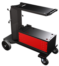
Trolley A3 TP 503 AC/DC (1) Trolley A3 W TP 503 AC/DC (2) Chariot A3 TP 503 AC/DC (1) Chariot A3 W TP 503 AC/DC (2) REF. PA109610 (1) REF. PA109218 (2)