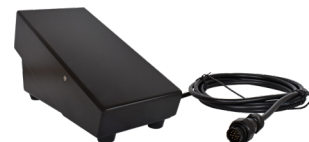
Pedal de controlo 3m Pedal de control remoto 3m REF. PF130043

Novo design mais atraente, robusto e versátil, com maior facilidade de transporte.