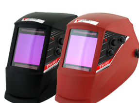
Máscara auto. MX 513 S vermelha (¹) Máscara auto. MX 513 S preta (²) Pantalla auto. MX 513 S roja (¹) Pantalla auto. MX 513 S negra (²) REF. CC108071 (¹) REF. CC108072 (²)