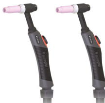
Tocha TIG 18W-4 cabo 4m (¹) Tocha TIG 18W-8 cabo 8m (²) Antorcha TIG 18W-4 cable 4m (¹) Antorcha TIG 18W-8 cable 8m (²) REF. CC107205 (¹) REF. CC107206 (²)