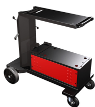
Carro A3 TP 403 (¹) Carro A3 TP 403 W (²) Carro A3 TP 403 (¹) Carro A3 TP 403 W (²) REF. PA109527 (¹) REF. PA109526 (²)