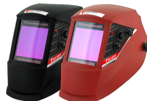
Welding helmet MX 513 S red (1) Welding helmet MX 513 S black (2) Masque automatique MX 513 S rouge (1) Masque automatique MX 513 S noir (2) REF. CC108071 (1) REF. CC108072 (2)