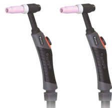
TIG torch 18W-4 cable 4m (1) TIG torch 18W-8 cable 8m (2) Torche TIG 18W-4 câble 4m (1) Torche TIG 18W-8 câble 8m (2) REF. CC107205 (1) REF. CC107206 (2)