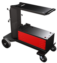
Trolley A3 TP 403 AC/DC (1) Trolley A3 W TP 403 AC/DC (2) Chariot A3 TP 403 AC/DC (1) Chariot A3 W TP 403 AC/DC (2) REF. PA109527 (1) REF. PA109526 (2)