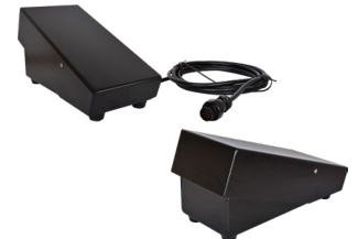
Foot pedal remote control 3m (1) Foot pedal remote control wireless (2) Pédale de commande à distance 3m (1) Pédale de commande à distance wireless (2) REF. PF130043 (1) REF. PA130005 (2)

New design more attractive, robust and versatile, with easier transport of equipment