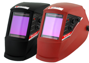
Máscara auto. MX 513 S vermelha (1) Máscara auto. MX 513 S preta (2) Pantalla auto. MX 513 S roja (1) Pantalla auto. MX 513 S negra (2)