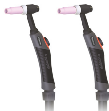
Tocha TIG 18W-4 cabo 4m (1) Tocha TIG 18W-8 cabo 8m (2) Antorcha TIG 18W-4 cable 4m (1) Antorcha TIG 18W-8 cable 8m (2)