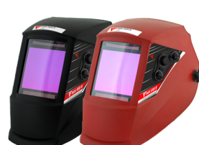
Máscara auto. MX 513 S vermelha (1) Máscara auto. MX 513 S preta (2) Pantalla auto. MX 513 S roja (1) Pantalla auto. MX 513 S negra (2) REF. CC108071 (1) REF. CC108072 (2)