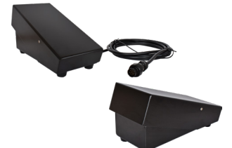
Pedal de controlo 3m (1) Pedal de controlo wireless (2) Pedal de control remoto 3m (1) Pedal de control remoto inalámbrico (2) REF. PF130043 (1) REF. PA130005 (2)

Novo design mais atraente, robusto e versátil, com maior facilidade de transporte.