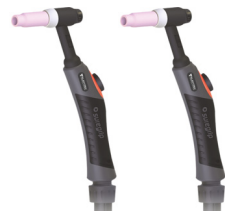
Tocha TIG 18W-4 cabo 4m (1) Tocha TIG 18W-8 cabo 8m (2) Antorcha TIG 18W-4 cable 4m (1) Antorcha TIG 18W-8 cable 8m (2) REF. CC107205 (1) REF. CC107206 (2)