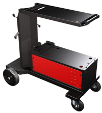
Carro A3 TP 323 AC/DC (1) Carro A3 W TP 323 AC/DC (2) Carro A3 TP 323 AC/DC (1) Carro A3 W TP 323 AC/DC (2) REF. PA109527 (1) REF. PA109526 (2)