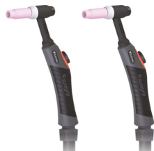
TIG torch 18W-4 cable 4m (1) TIG torch 18W-8 cable 8m (2) Torche TIG 18W-4 câble 4m (1) Torche TIG 18W-8 câble 8m (2) REF. CC107205 (1) REF. CC107206 (2)