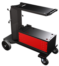
Trolley A3 TP 323 AC/DC (1) Trolley A3 W TP 323 AC/DC (2) Chariot A3 TP 323 AC/DC (1) Chariot A3 W TP 323 AC/DC (2) REF. PA109527 (1) REF. PA109526 (2)