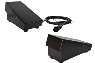
Foot pedal remote control 3m (1) Foot pedal remote control wireless (2) Pédale de commande à distance 3m (1) Pédale de commande à distance wireless (2) REF. PF130043 (1) REF. PA130005 (2)

New design more attractive, robust and versatile, with easier transport of equipment