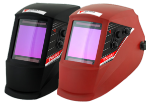
Welding helmet MX 513 S red Welding helmet MX 513 S black Masque autom. MX 513 S rouge Masque autom. MX 513 S noir REF. CC108071 (1) REF. CC108072 (2)