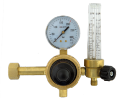
Flowmeter Electrex Ar/CO2 Débitlire à colonne Ar/CO2 REF. CC104224

Watch the video about TIG Dynamics and discover the advantages this function of TP Electrex machines have to offer. Regardez notre vidéo sur le TIG Dynamics et découvrez les avantages de cette fonction sur les machines TP Electrex.