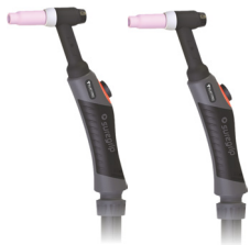
TIG torch 26-4 cable 4m (1) TIG torch 26-8 cable 8m (2) Torche TIG 26-4 câble 4m (1) Torche TIG 26-8 câble 8m (2) REF. CC107203 (1) REF. CC107204 (2)