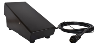
Foot pedal remote control 3m Pédale de commande à distance 3m REF. PF130043