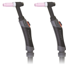
Tocha TIG 26-4 cabo 4m (1) Tocha TIG 26-8 cabo 8m (2) Antorcha TIG 26-4 cable 4m (1) Antorcha TIG 26-8 cable 8m (2) REF. CC107203 (1) REF. CC107204 (2)