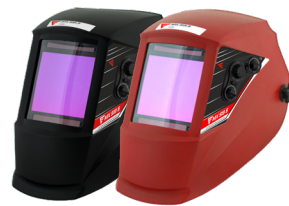
Máscara auto. MX 513 S vermelha (1) Máscara auto. MX 513 S preta (2) Pantalla auto. MX 513 S roja (1) Pantalla auto. MX 513 S negra (2) REF. CC108071 (1) REF. CC108072 (2)