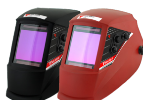
Welding helmet MX 513 S red (1) Welding helmet MX 513 S black (2) Masque automatique MX 513 S rouge (1) Masque automatique MX 513 S noir (2) REF. CC108071 (1) REF. CC108072 (2)