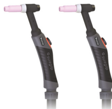
TIG torch 26-4 cable 4m (1) TIG torch 26-8 cable 8m (2) Torche TIG 26-4 câble 4m (1) Torche TIG 26-8 câble 8m (2) REF. CC107203 (1) REF. CC107204 (2)