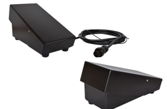
Foot pedal remote control 3m (1) Foot pedal remote control wireless (2) Pédale de commande à distance 3m (1) Pédale de commande à distance wireless (2) REF. PF130043 (1) REF. PA130005 (2)