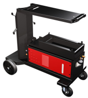
Trolley A3 TP 203 AC/DC (1) Trolley A3 W TP 203 AC/DC (2) Chariot A3 TP 203 AC/DC (1) Chariot A3 W TP 203 AC/DC (2) REF. PA109525 (1) REF. PA109524 (2)