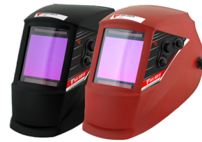
Welding helmet MX 513 S red Welding helmet MX 513 S black Masque autom. MX 513 S rouge Masque autom. MX 513 S noir REF. CC108071 (1) REF. CC108072 (2)