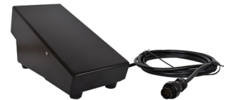
Foot pedal remote control 3m Pédale de commande à distance 3m REF. PF130043

■ TP Inverter with Hot Start, Arc Force and pulsed MMA functions for better welding results. Inverter TP avec fonction Hot Start, Arc Force et MMA pulsé pour de meilleurs résultats de soudage.