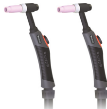
TIG torch 17-4 cable 4m (1) TIG torch 17-8 cable 8m (2) Torche TIG 17-4 câble 4m (1) Torche TIG 17-8 câble 8m (2) REF. CC107201 (1) REF. CC107202 (2)