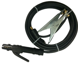
Welding cables 300A Jeu de câbles 300A