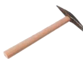
Picadeira 525g Piqueta 525g