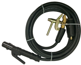
Welding cables 1000A Jeu de câbles 1000A