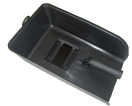
Máscara de mão MM1010 Pantalla de mano MM1010