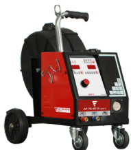
Alimentador AF 76.4R DIGIT II (1) Devanadora AF 76.4 R DIGIT II (1) Alimentador AF 76.4R W DIGIT II (2) Devanadora AF 76.4R W DIGIT II (2) REF. PA08EL030P(1) REF. PA08EL031Q(2)