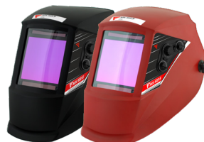
Máscara auto. MX 513 S vermelha (1) Máscara auto. MX 513 S preta (2) Pantalla auto. MX 513 S roja (1) Pantalla auto. MX 513 S negra (2) REF. CC108071(1) REF. CC108072(2)