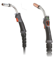
Tocha MIG 36-3 cabo 3m (1) Tocha MIG 501W-3 cabo 3m (2) Antorcha MIG 36-3 cable 3m (1) Antorcha MIG 501W-3 cable 3m (2) REF. CC107211(1) REF. CC107215(2)