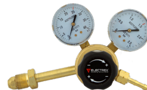
Debitómetro Ar/CO2 Caudalímetro Ar/CO2 REF. CC104219

Máquinas robustas e potentes, para soldadura MIG e MAG de alta qualidade com fio sólido e fluxado. Máquinas robustas y potentes para soldaduras MIG y MAG de alta calidad con hilo sólido y flujados.