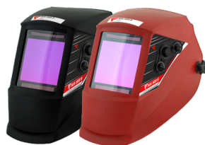
Welding helmet MX 513 S red (1) Welding helmet MX 513 S black (2) Masque autom. MX 513 S rouge (1) Masque autom. MX 513 S noir (2) REF. CC108071 (1) REF. CC108072 (2)