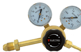
Gas regulator Ar/CO2 Débitlire Ar/CO2 REF. CC104219