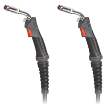
MIG torch 25-3 cable 3m (1) MIG torch 25-4 cable 4m (2) Torche MIG 25-3 câble 3m (1) Torche MIG 25-4 câble 4m (2) REF. CC107209 (1) REF. CC107210 (2)