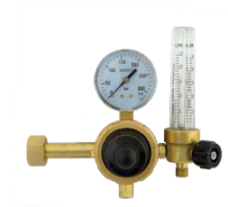
Flowmeter Ar/CO2 Débitre avec colonne Ar/CO2