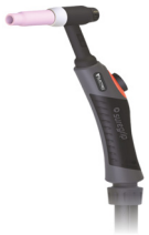
TIG torch ELECTREX 17-4 Torche TIG ELECTREX 17-4