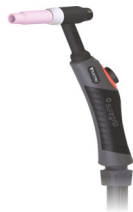
TIG torch ELECTREX 26-4 Torche TIG ELECTREX 26-4