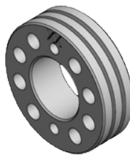
Rolete Flux 1,6-2,0mm (1) /1,6-2,4mm (2) /2,4-2,8mm (3) Rodillo arrastre Flux 1,6-2,0mm (1) /1,6-2,4mm (2) /2,4-2,8mm (3) 300A (3)

REF. C0105545 (1) REF. C0105546 (3) REF. C0105204 (2)