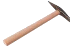
Chipping hammer 525g Marteau à piquer 525g