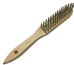
Steel brush (4 row) Brosse acier 4 rangs