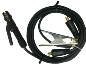
Jogo de cabos 200A Juego de cables 200A