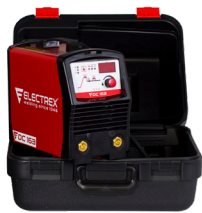
Maleta para Inverter 42X34X25 Maletín para Inverter 42X34X25